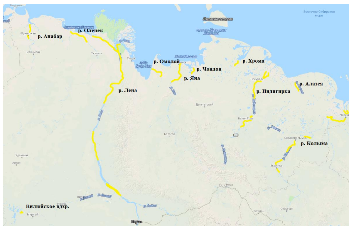
Рисунок 1 – Карта-схема мест наибольшей концентрации рыболовных участков на реках Якутии и Вилуйском водохранилище (выделены желтым цветом)

Промысел водных биоресурсов в Якутии сконцентрирован в бассейнах нижних течений рек (рисунок 1).